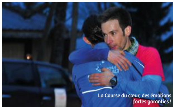
La Course du cœur, des émotions fortes garanties !

Une vingtaine d'équipes s'élancera, le 29 mars prochain, depuis le centre de Paris pour rallier la station des Arcs en Savoie. Elles courront près de 750 km en relais, durant quatre jours non-stop, pour sensibiliser le grand public au don d'organes.