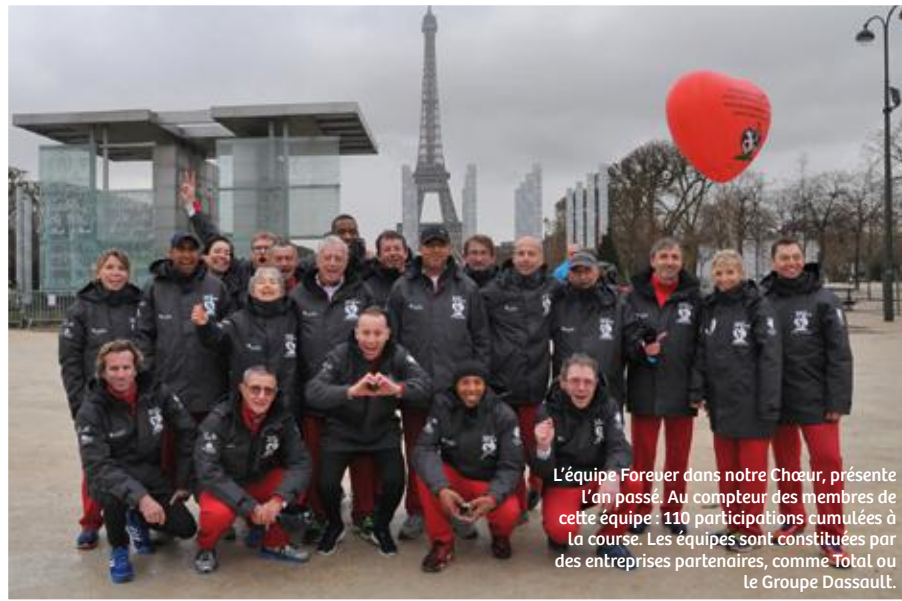
L'équipe Forever dans notre Cœur, présente l'an passé. Au compteur des membres de cette équipe : 110 participations cumulées à la course. Les équipes sont constituées par des entreprises partenaires, comme Total ou le Groupe Dassault.