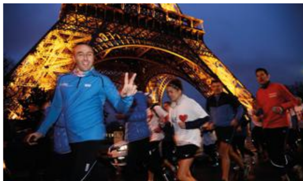
De jour comme de nuit, les participants à la Course du cœur courent de Paris jusqu'aux Alpes, pendant quatre jours.

20 000 Plus de 20 000 personnes se trouvent aujourd'hui sur liste d'attente de greffes en France. Et plus de 200 décèdent chaque année faute d'organes disponibles. D'où le message : « Pour ou contre, l'important c'est de l'avoir dit ». Pour en savoir plus : > www.dondorganes.fr .